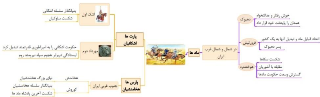
شکل ۱- سه قوم آریایی‌ها (مطالعات هفتم)