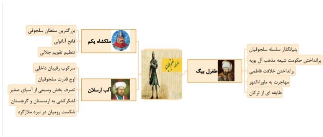
شکل ۲- سلسله سلجوقیان (مطالعات هشتم)