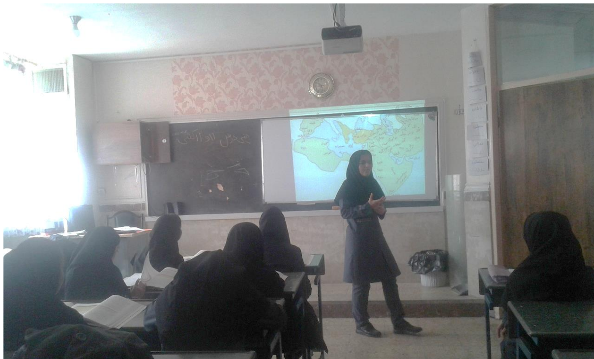
شکل ۷: همیار معلم در کلاس