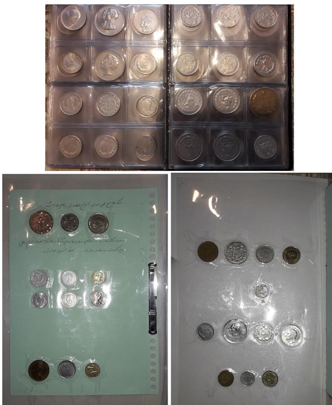
شکل ۱: مجموعه سکه‌ها برای ارائه در کلاس

در کنار این موارد، تشکیل نمایشگاه‌های دست‌سازه‌های دانش‌آموزی در پایه‌های مختلف (شکل ۵)، علاوه بر افزایش جذابیت درس تاریخ، باعث می‌شود که دانش‌آموزان، خود داوطلبانه برای تهیه و ساخت این وسایل اعلام آمادگی نمایند که نتیجه آن، تقویت موقعیت درس تاریخ در مدرسه می‌باشد.