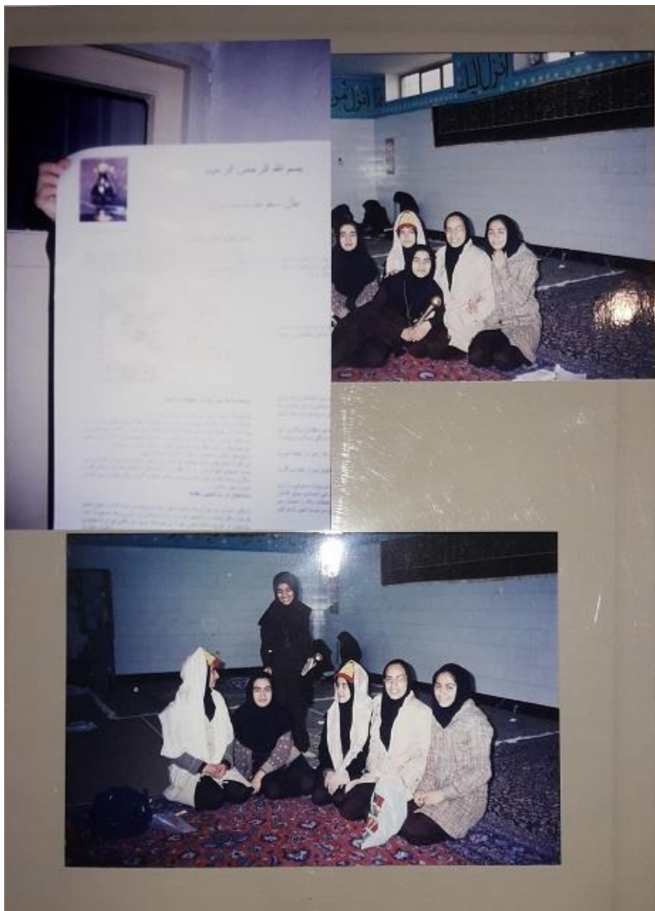
شکل ۶: مسابقات کنفرانس دانش‌آموزی و تهیه پوستر