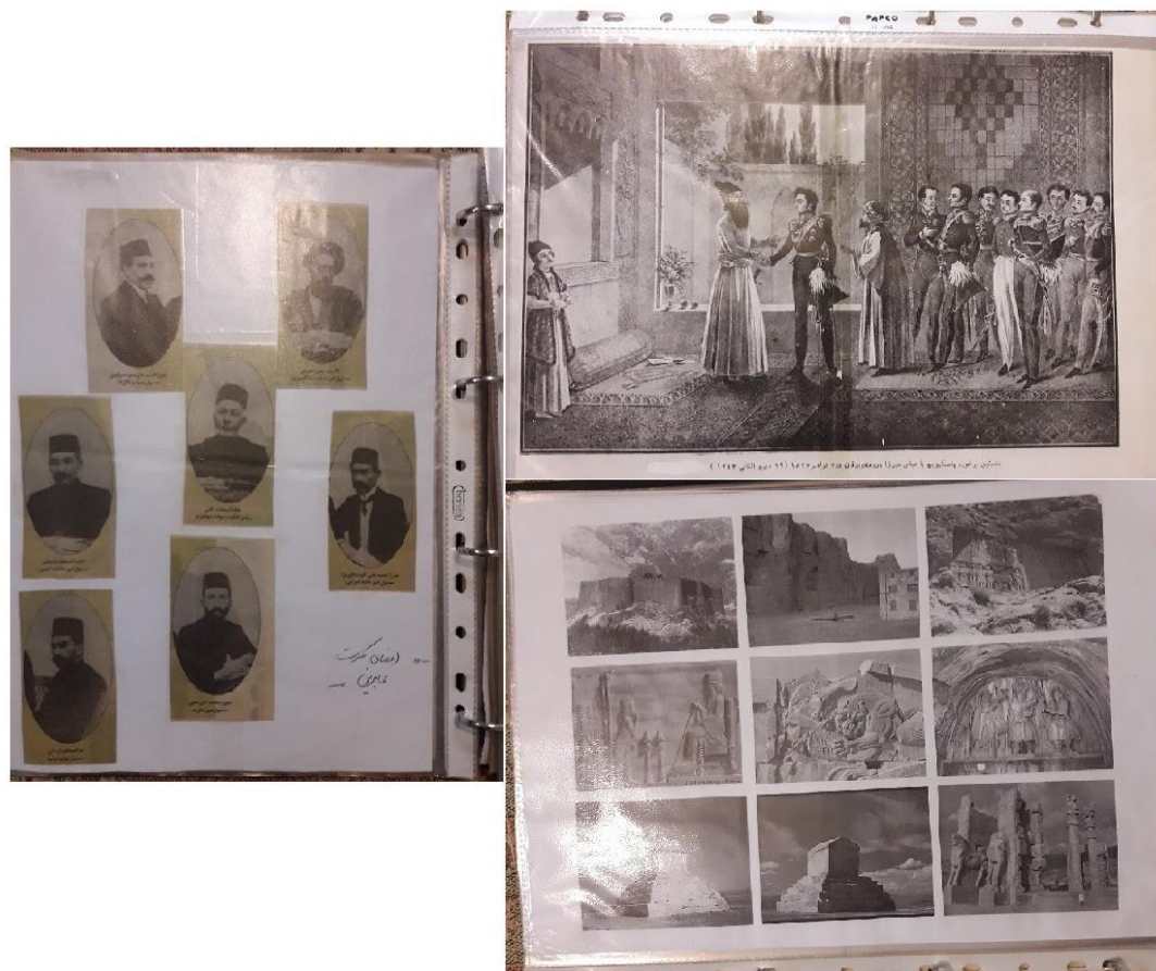
شکل ۲: نمونه‌ای از تصاویر برای ارائه در کلاس

همچنین شرکت دادن دانش‌آموزان در انواع مسابقات و المپیادهای علمی تاریخ، کنفرانس‌های علمی (شکل ۶) و مسابقات همیار معلم در سطوح مختلف، از دیگر تجاربی است که در سال‌های تدریس این درس داشته‌ام که در افزایش عمق یادگیری و تقویت اعتماد به نفس دانش‌آموزان و مسئولیت‌پذیری آنها در زندگی اثربخش است.