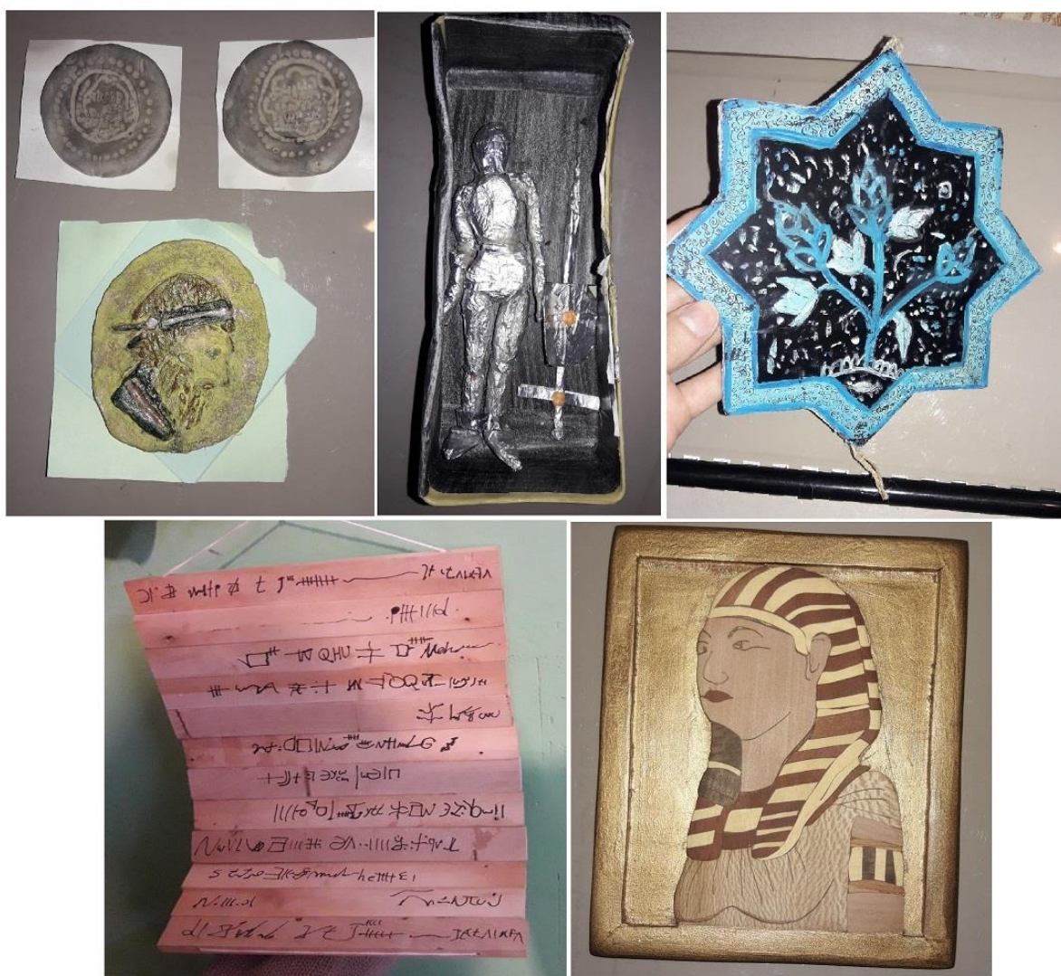
شکل ۵: نمونه‌هایی از دست‌سازه‌های دانش‌آموزان

فعالیت‌ها که نیاز به ارائه نظر هر گروه دارد، به نوبت توسط گروه‌ها بازگو می‌شود و کامل‌ترین نظر پیشنهادی، توسط همیار معلم و زیر نظر دبیر، انتخاب و توسط دانش‌آموزان ثبت می‌شود. همیار معلم برای تدریس جذاب‌تر درس می‌تواند از روش‌های بارش فکری، اکتشافی، ارائه محتوای الکترونیکی و کلیپ‌های آموزشی استفاده نماید. استفاده از این روش مزایای بسیاری دارد. کلاس درس را از حالت رسمی خارج نموده و دوستی و صمیمیت را میان دانش‌آموزان افزایش می‌دهد و چون همه دانش‌آموزان به نحوی درگیر درس بوده‌اند، دانش‌آموزان ضعیف‌تر نیز توانمندی‌های ذهنی خود را تقویت و اشکالات درسی خود را رفع می‌نمایند. در این روش، نقش کلیدی معلم در امر تدریس، به راهنمای عمل تغییر می‌کند و اندیشه‌ها و ذهن همه دانش‌آموزان به نحوی درگیر درس می‌شود و یادگیری اثربخش و ماندگار در ذهن و روح و روان آنها پدید می‌آید.